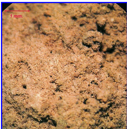
SUELO SIN REGENSOIL

El fabricante garantiza que el producto está compuesto por ingredientes que son aptos para el uso aquí citado cuando se emplea de acuerdo con las instrucciones. La empresa garantiza únicamente la formulación y el contenido neto del producto. Debido que el uso de este producto está fuera de nuestro control, no damos garantía expresa ni implícita sobre efectos o resultados inherentes a su uso, tanto si se emplea o no de acuerdo a las indicaciones. No acepta responsabilidad por daños a personas, pérdidas o daños en propiedad ajena que pudiera resultar de su empleo.